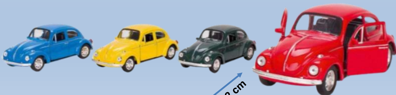
12130 1:34 Volkswagen Classic Beetle (1960), 4 cores diferentes