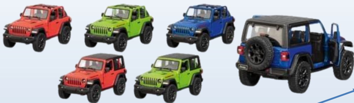
12314 1:34 Jeep Wrangler (2018), 6 cores diferentes