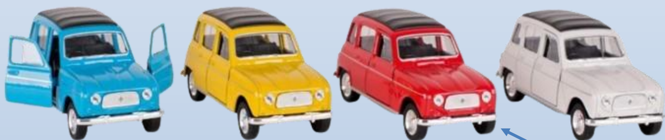
12264 1:34 Renault 4L, 4 cores diferentes